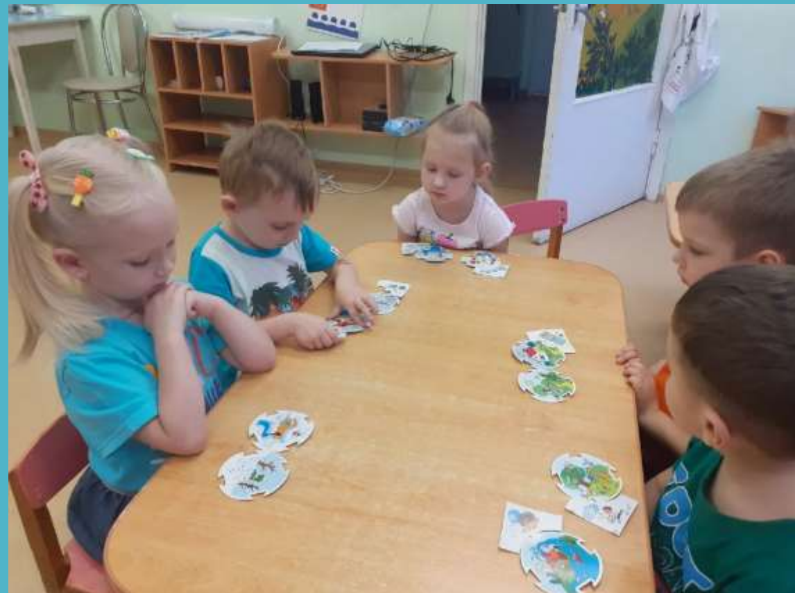
«Когда это бывает?»