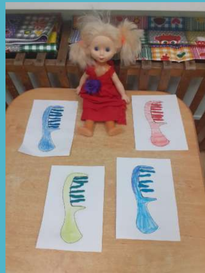
«Расческа для куклы Кати»