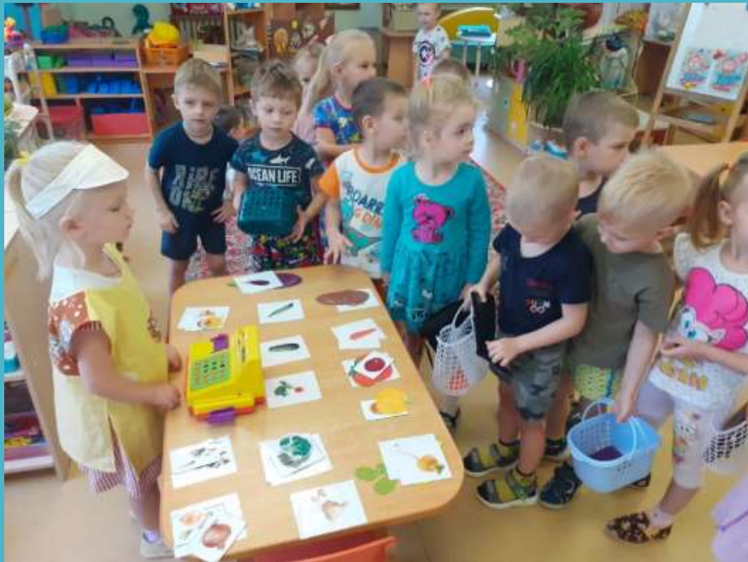
«Магазин овощей и фруктов»