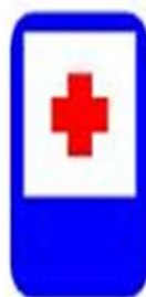
Пункт первой медицинской помощи