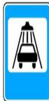
7.5 Мойка автомобилей