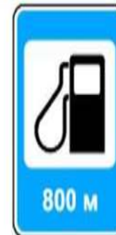
7.3 Автозаправочная станция