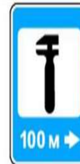
7.4 Техническое обслуживание автомобилей