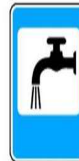
7.8 Питьевая вода