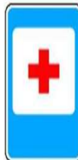
7.1 Пункт первой медицинской помощи