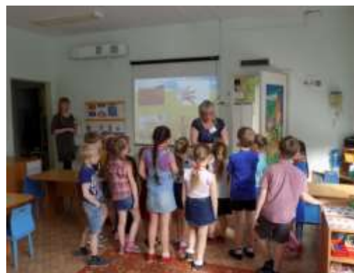
Рассматривание Ответы детей

Пятое задание. Игра «Состав числа 5 и 6 из двух меньших»